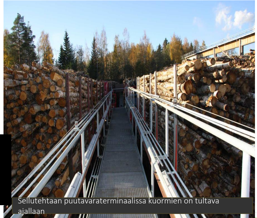
Sellutehtaan puutavaraterminalissa kuormien on tultava ajallaan

Velvollisuutemme työnantajana olisi monesti varmistaa turvallisuus pysäyttämällä liikenne - ja samalla pettää asiakkaan luottamus .