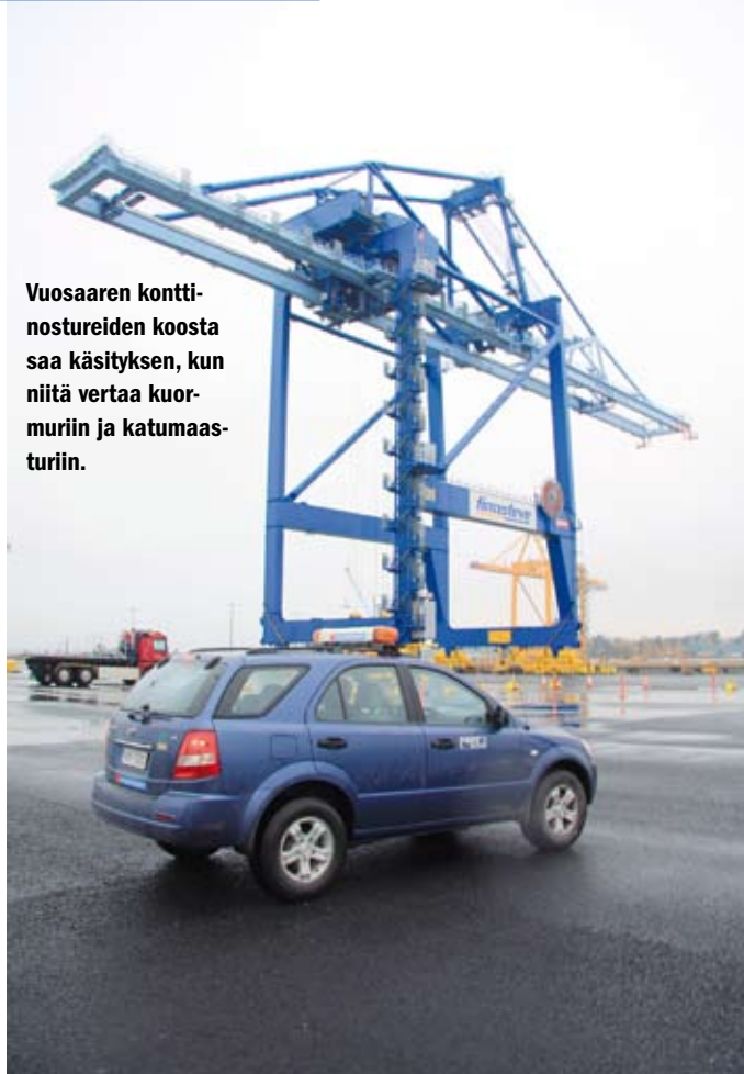
Vuosaaren kontti- nostureiden koosta saa käsityksen, kun niitä vertaa kuor- muriin ja katumaas- turiin.

Vuosaaren sataman toimi- vuudesta ja tulevaisuudesta Noroviita toteaa, että perus- konsepti eli sijainti ja kapa- siteetti tekevät satamasta eh-