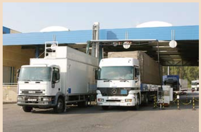
Seisovat ne rekat muuallakin. Viron ja Venäjän rajalla odotetaan keski- määrin 80 tuntia ja Puolan ja Venäjän rajalla 18 tuntia.

– Laki pudotti raja- alu- eella toimivien viranomais- ten määrän kahteen. Sinän- sä uudistus on tervetullut, mutta venäläiseen tyyliin käytännön toteutusta ei ol-