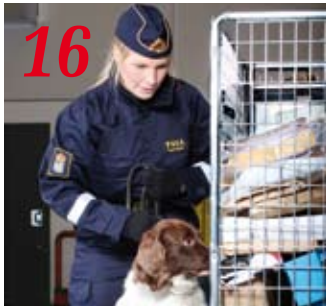
2000-luvun tulli on monitoimilaitos.