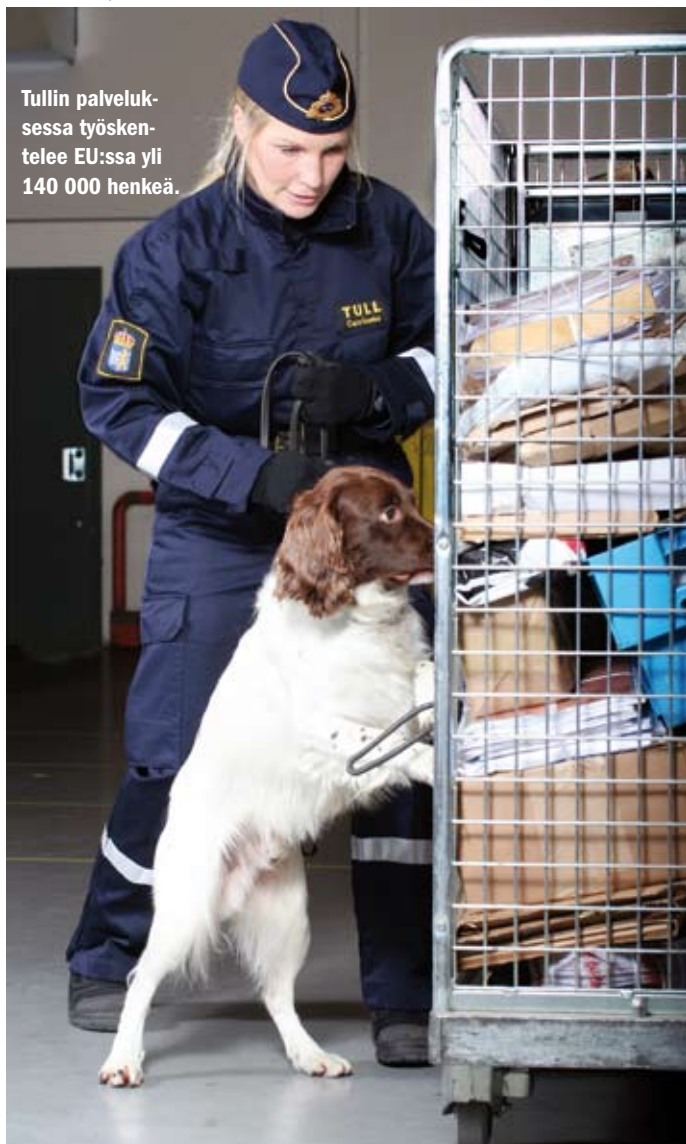
Tullin palveluksessa työskentelee EU:ssa yli 140 000 henkeä.

Tullin viranomaiset käsittelevät vuosittain lähes 183 miljoonaa tulli-ilmoitusta – noin kuusi kappaletta joka sekunti.