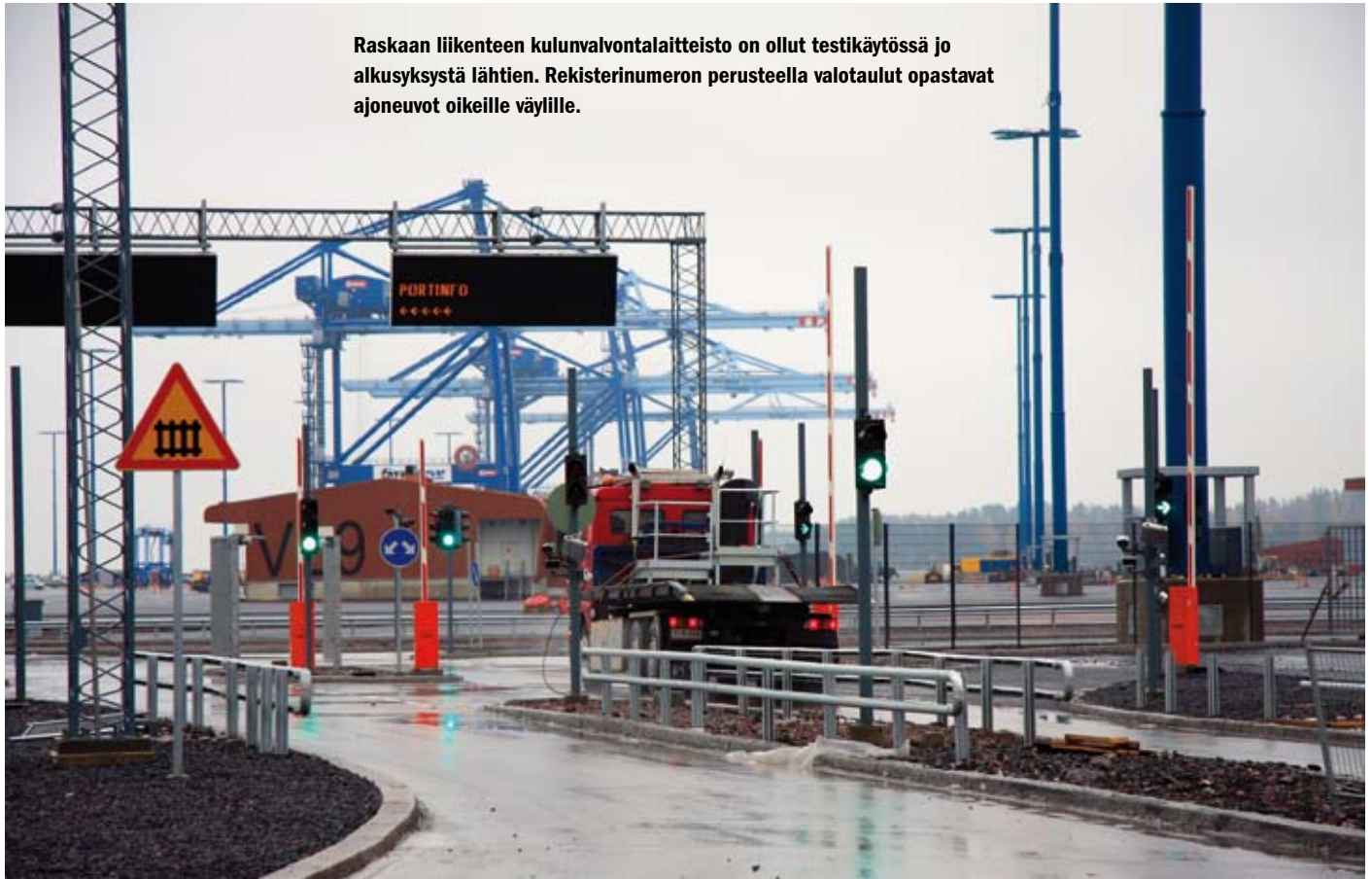
Raskaan liikenteen kulunvalvontalaitteisto on ollut testikäytössä jo alkusyksystä lähtien. Rekisterinumeron perusteella valotaulut opastavat ajoneuvot oikeille väylille.