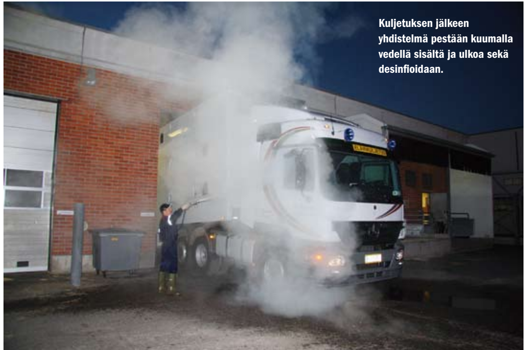
Kuljetuksen jälkeen yhdistelmä pestään kuumalla vedellä sisältä ja ulkoa sekä desinfioidaan.

voimassa olevien säädösten mukaan sekä kuunnellaan mitä heillä on sanottavana, pysyvät asenteet kohdallaan – puolin ja toisin, Olli painottaa.