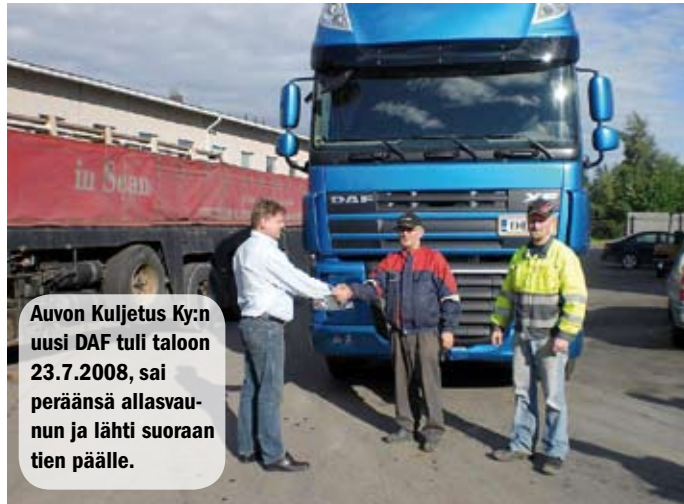
Auvon Kuljetus Ky:n uusi DAF tuli taloon 23.7.2008, sai peräänsä allasvaunun ja lähti suoraan tien päälle.

– Aikaisemmin hankimme kaluston käytettynä, mutta riittävän hyväkuntoisena ja valmiiksi tulevaan käyttötehtäväänsä varusteltuna, joten taloon tullut auto saatiin nopeasti liikenteeseen. Ei siis tarvinnut kärsiä uusien au-