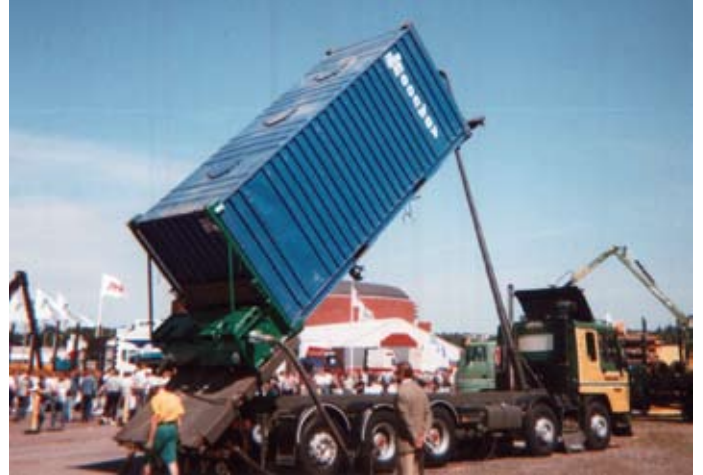
Honkasteen 5-akselisia kuorma-autoja – tässä Volvo FL10 VTA 10x4 – konttityhennyslaitteineen esiteltiin mm. Turun Kuljetuspalvelu-messuilla vuonna 1996.

Honkasteen tärkeimmäksi suoritealaksi on viime vuosina muodostunut ulkomaisten irtoperävaunujen veto 2- tai 3-akselisilla vetoautoilla. Lisäksi palvelutarjontaan kuuluu vaunujen pienimuotoiset huolto- ja korjaustyöt sekä