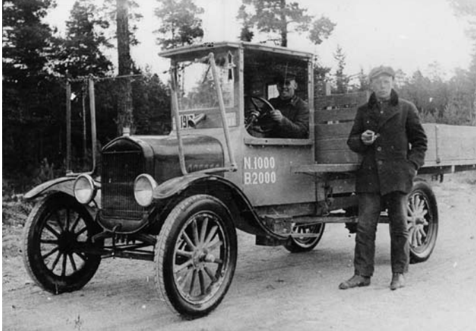
Se kuuluisa, kavennetulla ohjaamolla varustettu kromppu-Hoppa vuodelta 1924, jolla näytettiin turkulaisille mallia kuinka pitkäkin tavara kulkee näppärästi automobiiliin kydyissä. Kuva on otettu vuonna 1927.

put”. Siksi myös auton ohjaamo oli kavennettava. Tuosta autosta lähtien Honkasteen kuljetusliikkeen kalusto on pääsääntöisesti hankittu kulloiseenkin kuljetustehtävään mahdollisimman hyvin räätälöitynä.