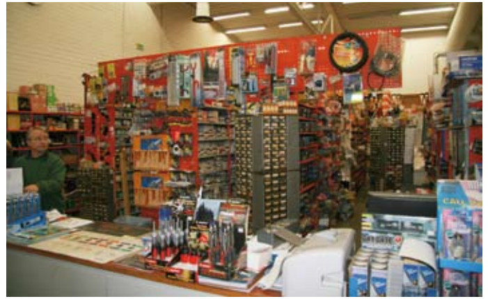
Puulan Kone Oy:n varaosa- ja tarvikemyymälä on tunnettu kattavasta valikoimastaan ja asiantuntevasta palvelustaan.

Viimeksi mainitun edeltäjineen Rauno sanoo ol-