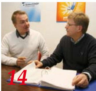
14 Kainuussa varaudutaan jo tulevaan.