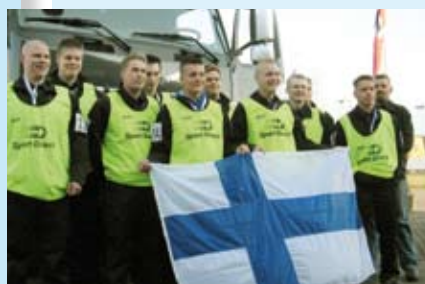
Suomen nuorille EM-hopeaa Tanskassa. s. 34