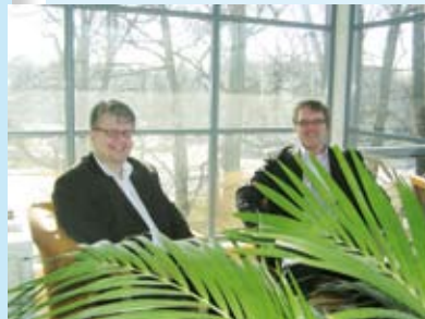
ERAA valvoo kuljetusalan etuja Virossa. s. 24