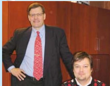
HKY:n uudet verkset voimat. s. 24